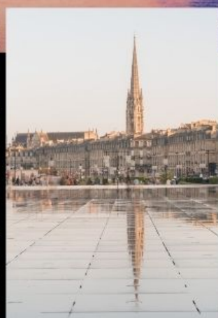
บอร์โกโด