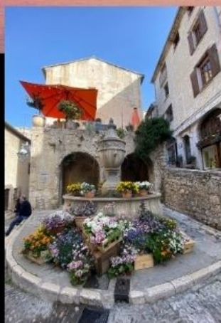
โพรวองซ์