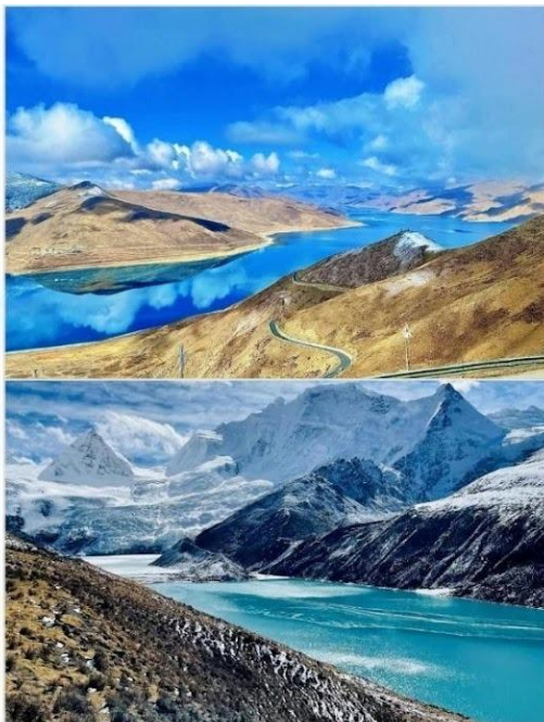
ทะเลสาบ หยัมดรอก (Yamdrok Tso, 羊湖)