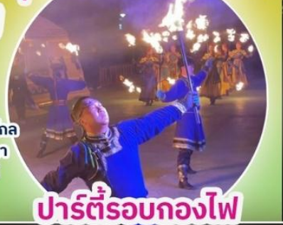
ปาร์ตี้รอบกองไฟ