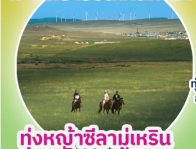
ทุ่งหญ้าซิล่ามูเหริน