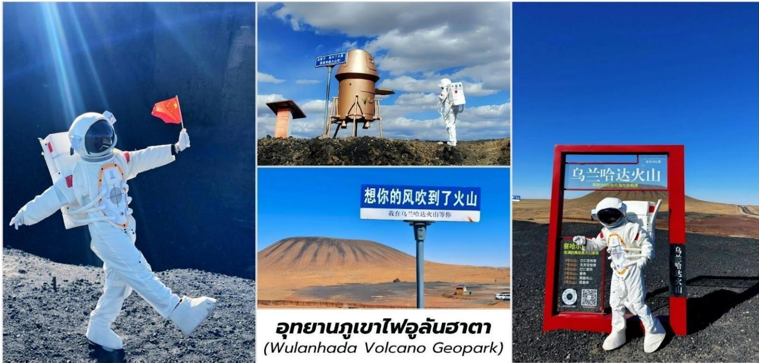
อุทยานภูเขาไฟอูลันฮาตา (Wulanhada Volcano Geopark)

คำ บริการอาหารค่ำ ณ ภัตตาคาร ที่พัก Shang Jing Hotel ระดับ 4* หรือเทียบเท่า