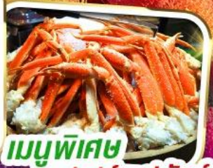
เมนูพิเศษ บุฟเฟต์ซาปูยักษ์

ราคาเพียง 35,999 *รวมภาษีมูลค่าเพิ่มแล้ว*