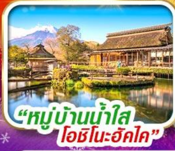
“หมู่บ้านน้ำใส โอชิโนะฮักไก”