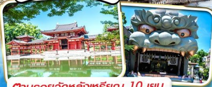
ตามรอยวัดหลังเหรียญ 10 เยน

รวม ค่าภาษีที่ปรับขึ้นแล้ว (ประกาศ 1 เม.ย. 69)