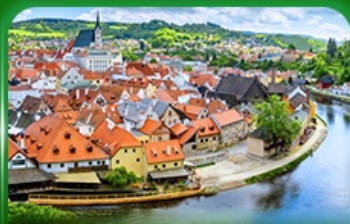
เมืองมรดกโลก เซสที่ครุมลอฟ