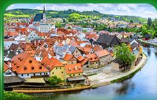
เมืองมรดกโลก เซสกีครุมลอฟ