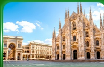
มหาวิหารดูโอโมแห่งมิลาน