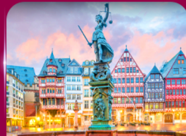
จัตุรัสโรเมอร์ แพรงก์เฟิร์ต