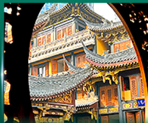
วัดพรวัดหลิวอัน