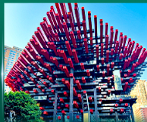
เขื่อนตึกตะเกียบ