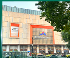
ศูนย์การค้าส่งเสื่อฟ้าไฟไฟสโตร์