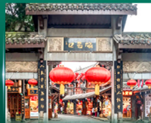
หมู่บ้านโบราณฉิวซีฟิว