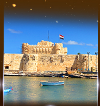
บ่อนประหาร Quite Bay