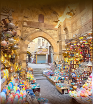
ตลาดห่านเอลคาลี