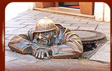
แลนด์มาร์คดัง รูปปั้นคูนิล ปรากติสลาว่า