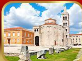
โบสถ์เซนต์โทมัส ซาการ์