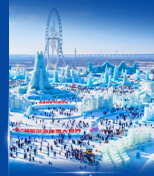
เทศกาลหิมะและน้ำแข็ง 2027