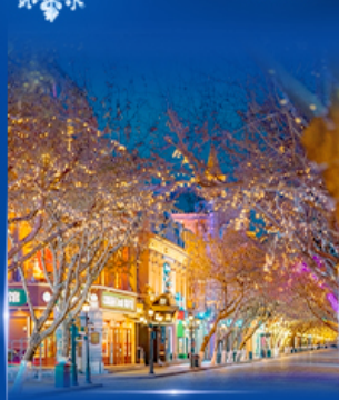
ย่านจงหยาง สตรีท