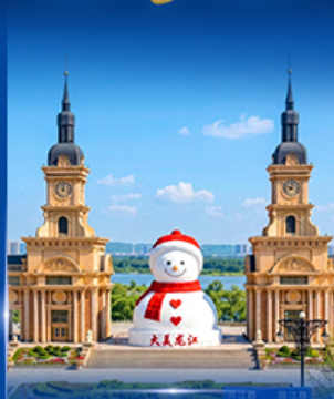
ตุ๊กตาหิมะยักษ์ ฮาร์บิน