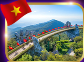
สะพานมือสีทอง ฮานอย