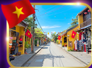
เมืองเก่าฮานอย