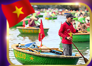
เรือกระด้ง หมู่บ้านกิมถาน