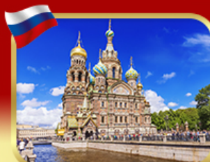
เซ็คอินโบสกแห่งหยดเลือด