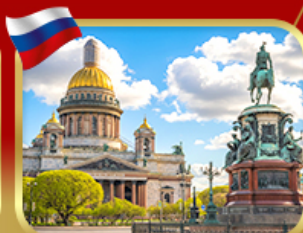
มหาวิทยาลัยเซนต์ไอแซค