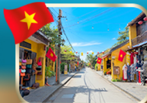
เที่ยวชมเมืองเก่ามรดกโลก ฮอยอัน