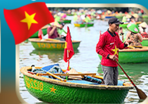
ล่องเรือกระด้ง ชมหมู่บ้านก๊อบกาน