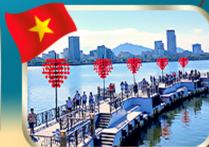
เช็คอินสะพานแห่งความรัก ดานัง