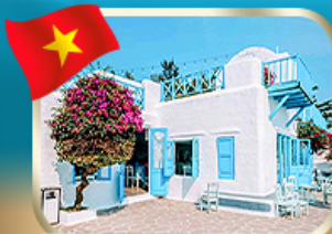
คาเฟ่สไตล์ชิคาโกสไตล์ ซันทร่า เทริน่า