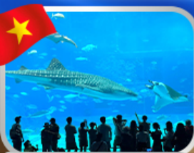
The Sea Shell Aquarium