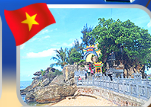
อัคราเรขอพราสาทเจ้าติงเทมา