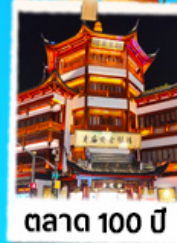
ตาด 100 ปี