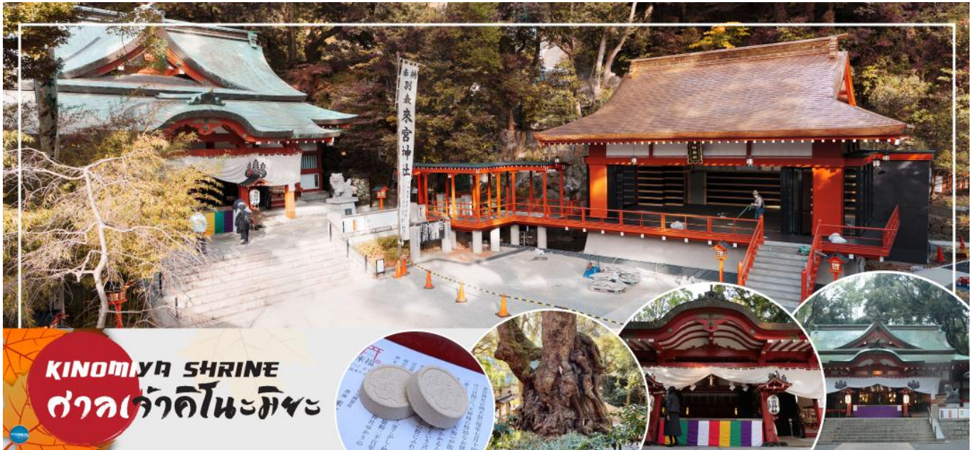
KINOMIYA SHRINE ศาลเจ้าคิโนะมิยะ

เพราะที่นี่ถือเป็นสิ่งสถิตของเทพเจ้าทั้งหลาย ซึ่งในปัจจุบันที่ถือเป็นตัวแทนของศาลเจ้าคิโนะมิยะทั้ง 44 ศาลเจ้าทั่วประเทศ เป็นศูนย์รวมของความเคารพบูชา นอกจากนี้ยังมีอนุสาวรีย์ธรรมชาติแห่งชาติ และยังมีต้นไม้ยักษ์ขนาดเส้นผ่านศูนย์กลาง 24 เมตร ตั้งอยู่ในเขตวัด ว่ากันว่าหากเดินวนรอบต้นไม้หนึ่งรอบ อายุก็จะยาวขึ้นไปอีกหนึ่งปีแม้ที่นี่จะดูน่าเกรงขามแต่พอเข้าไปกลับรู้สึกอุ่นใจ ผู้ที่มาขอให้ตนสามารถเลิกเหล้า เลิกบุหรี่ให้สำเร็จก็มีมาก และยังมีเครื่องรางความรักสุดน่ารักวางขายอีกด้วย