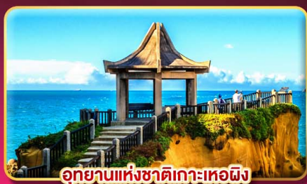
อุทยานแห่งชาติเกาะเหอผิง

ชมพลุข้ามปีฉลองเทศกาลปีใหม่ 2027 แช่น้ำแร่ส่วนตัวในห้องพัก