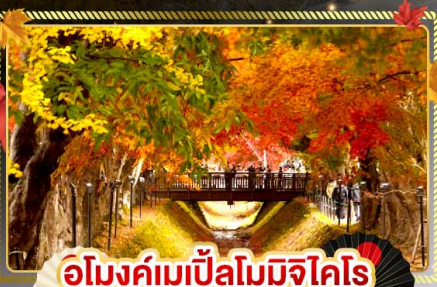
อุโมงค์เมเปิ้ลโมมิจิโคโร