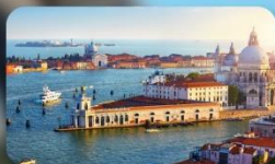
ชมความงามเมืองเวนิส