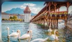
สะพานไม้ซาเปล