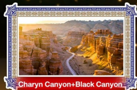
Charyn Canyon+Black Canyon