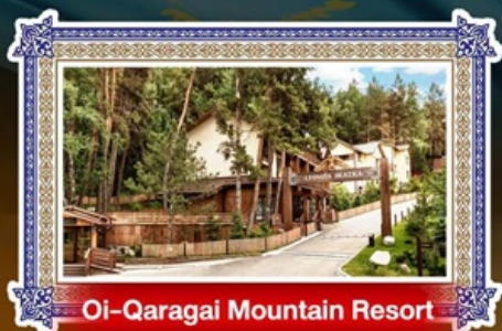
Oi-Qaragai Mountain Resort