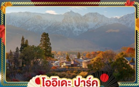
ไออิเดะปาร์ค