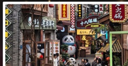
หมู่บ้านสี่牌坊