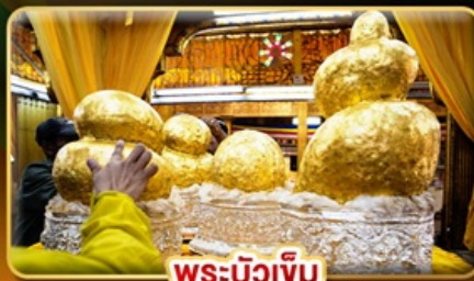
พระบิวเข้ม