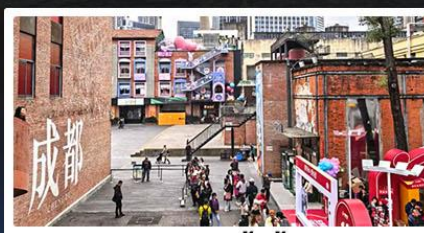
ตงเจียวจื้ออี้