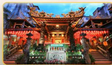
วัดเทียนโฮ่ว จอพริเจ้าแม่หม่าจู