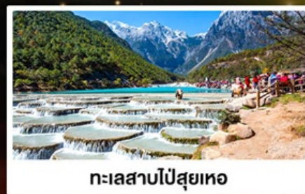
ทะเลสาบโป๋สือเหอ