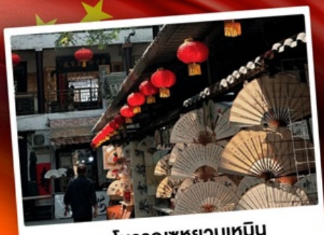
ถนนโบราณชวณชื่นเหมิน

"มรดกโลกพันปี สุสานทหารดินเผา" แต่งชุดจีนโบราณ เดินถนนวัฒนธรรมต้าถิง