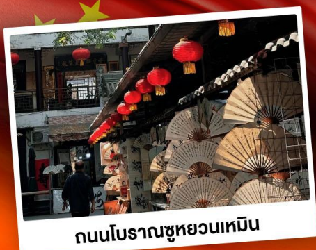
ถนนโบราณชวฮวงเหมิน