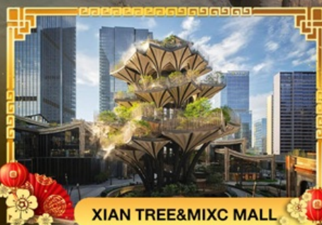
XIAN TREE&amp;MIXC MALL