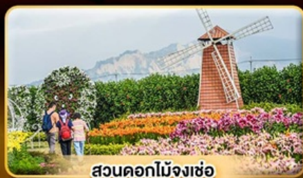
สวนดอกไม้จางเซ่อ

ค่าที่ล่าวน้ตึกไทเป 101 แช่น้ำแร่ส่วนตัวในห้องพัก