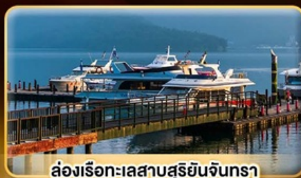
ล่องเรือทะเลสาบสุริยจันทร์