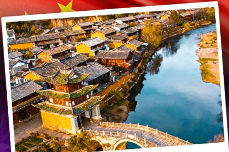
เมืองโบราณซาซี

ชมดอกไม้บานสะพรั่งทั่วยูนนาน "เซ็ดอันดาเฟี้ยวสุดอลัง"