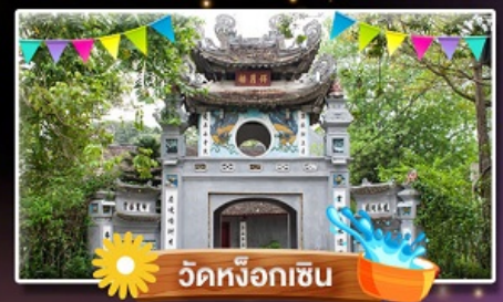
วัดหิ่งฮ็อกเซิน