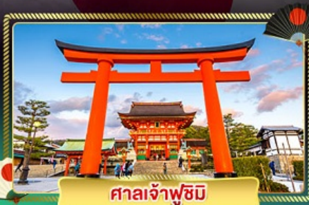
ศาลเจ้าฟูชิมิ