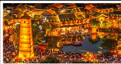
เมืองโบราณลั่วหยี่