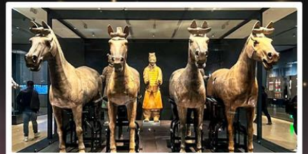
สุสานทหารจิ้งซี