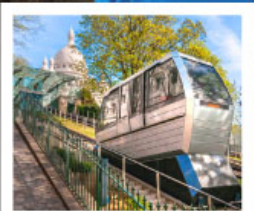
ขึ้นรางสู่สมมาร์ต