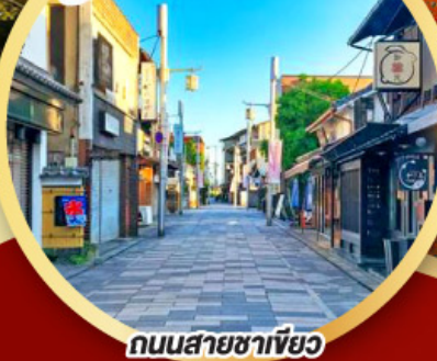
ถนนสายชาเขียว