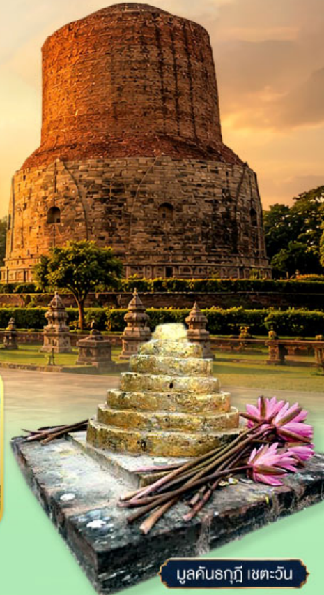
มุลคินรฤฎี เขต-วัน