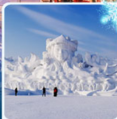
งานแกะสลัก เกาะพระอาทิตย์