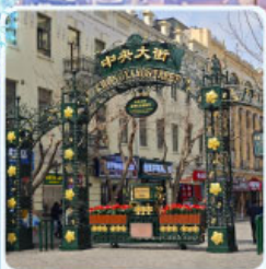
ถนนจงยาง