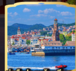
ท่าเรือประมงต้าเหลียน