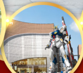
กินดื่ม ปาร์ค ฟุคุโอกะ