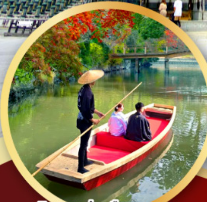
กิจกรรมล่องเรือยามากาวะ