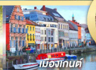
เมืองกันต์