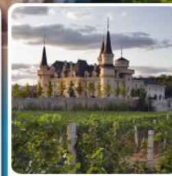
ไร่ไวน์ จุนยี่ เยียนโก