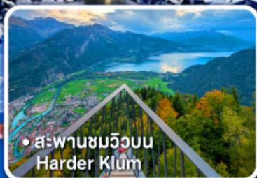
• สะพานชมวิวยอบบ Harder Klum