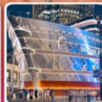
เรือหลุยส์