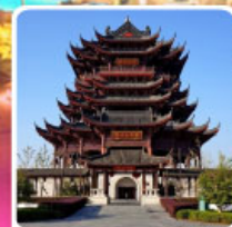
วัดหลงหยวน