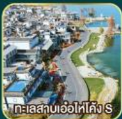
ทะเลสาบเอ๋อไห่คัง S