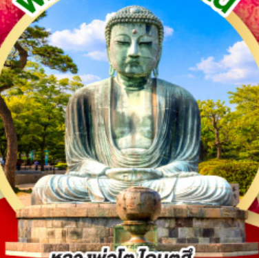
หลวงพ่อดโต โดบุตสึ