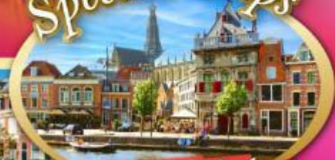
เก็บครบเบเนลักซ์ แะที่ฮาร์เล็ม