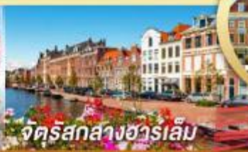
จัตุรัสกลางฮาร์เล็ม