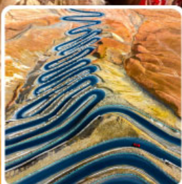
ถนนผานหลงกู่ต้าว